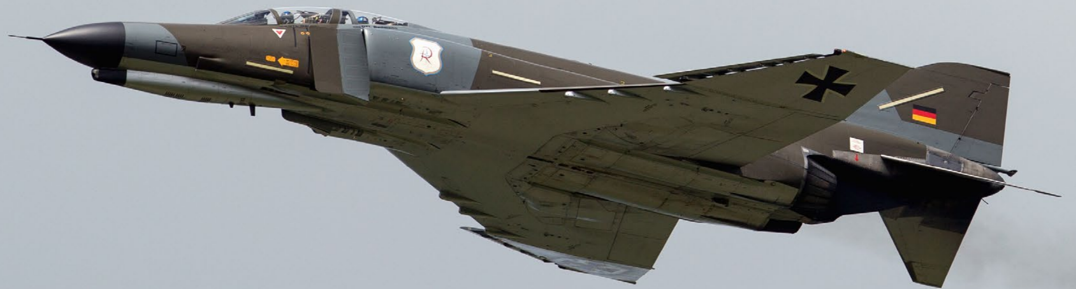
"Phantom Pharewell" og en retro F-4 i tæt formation under showet.