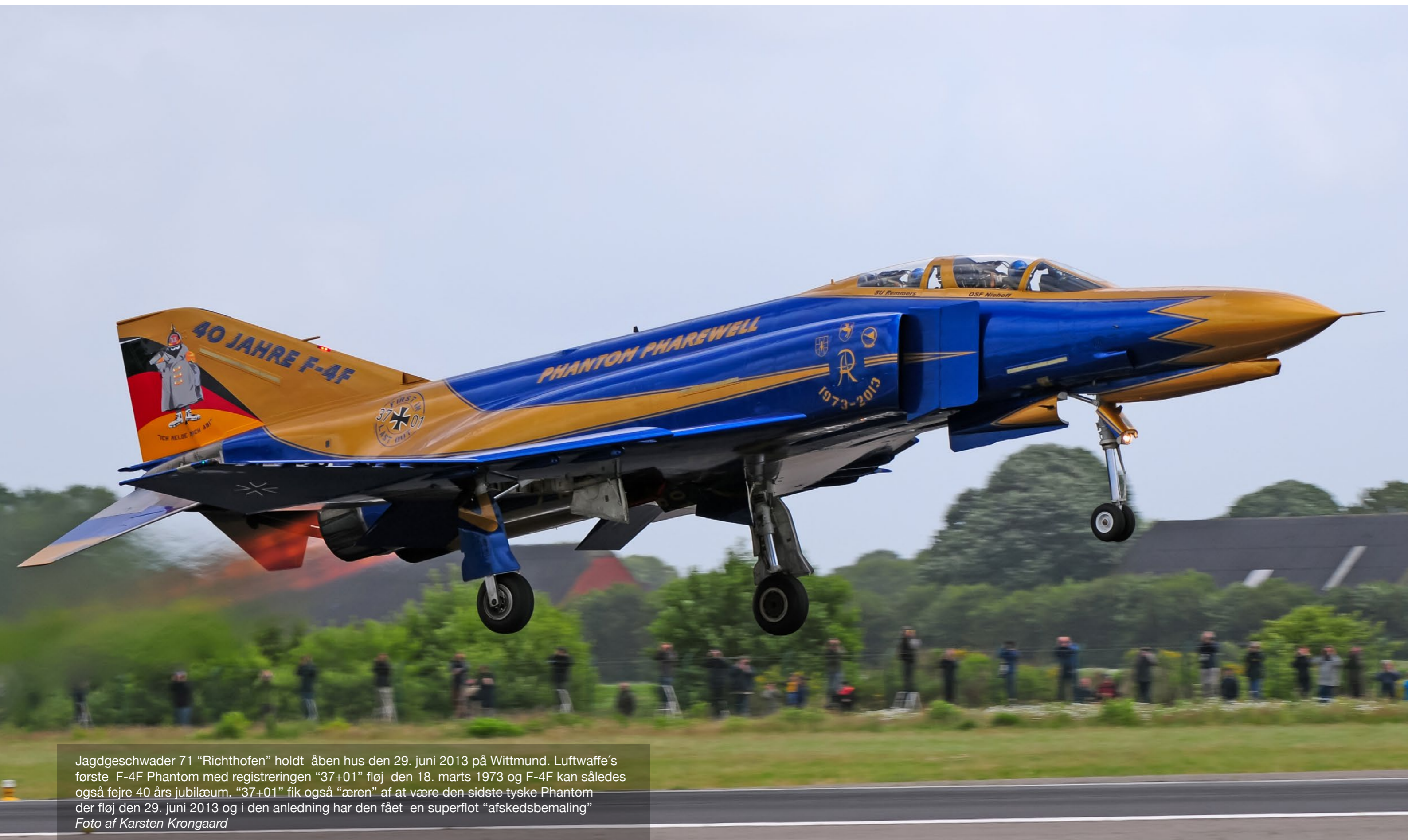
Jagdgeschwader 71 "Richthofen" holdt åben hus den 29. juni 2013 på Wittmund. Luftwaffe's første F-4F Phantom med registreringen "37+01" fløj den 18. marts 1973 og F-4F kan således også fejre 40 års jubilæum. "37+01" fik også "æren" af at være den sidste tyske Phantom der fløj den 29. juni 2013 og i den anledning har den fået en superflot "afskedsbemaling"

UDVALGTE TEMA FOTOS INDSENDT AF VORES LÆSERE