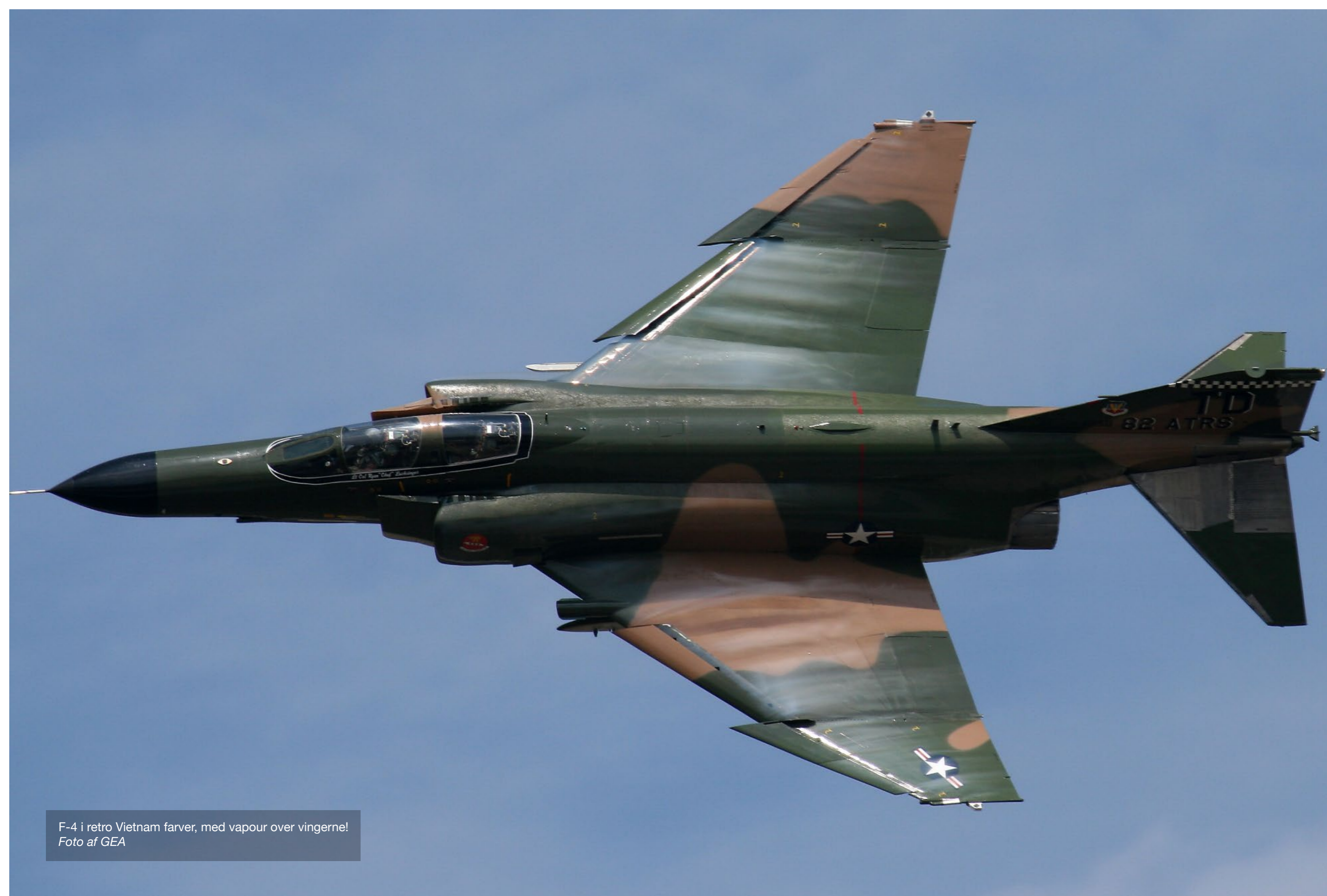
F-4 i retro Vietnam farver, med vapour over vingerne!