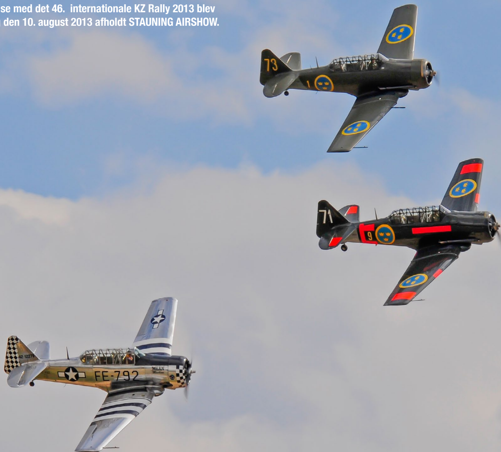
Formation med 3 x T-6/ Harvard fra Swedish Air Force Historic Flight

I forbindelse med det 46. internationale KZ Rally 2013 blev der lørdag den 10. august 2013 afholdt STAUNING AIRSHOW.