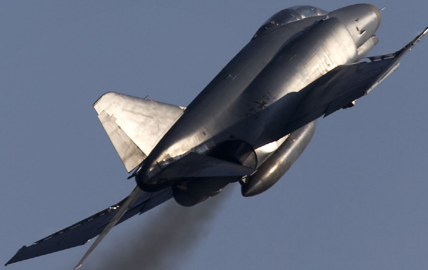
Den legendariske Phantom røg ses tydeligt på denne tyske F-4.