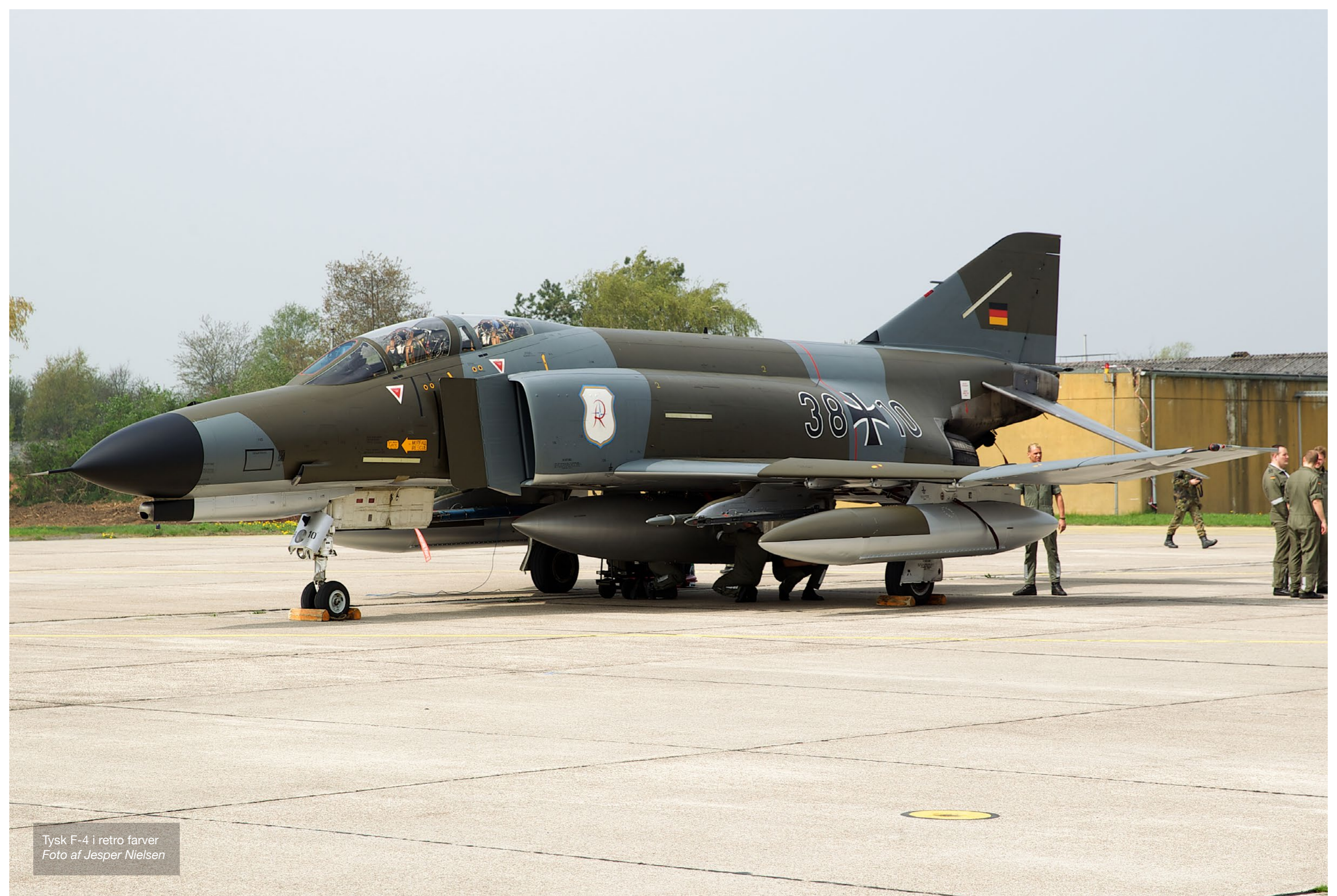
Tysk F-4 i retro farver