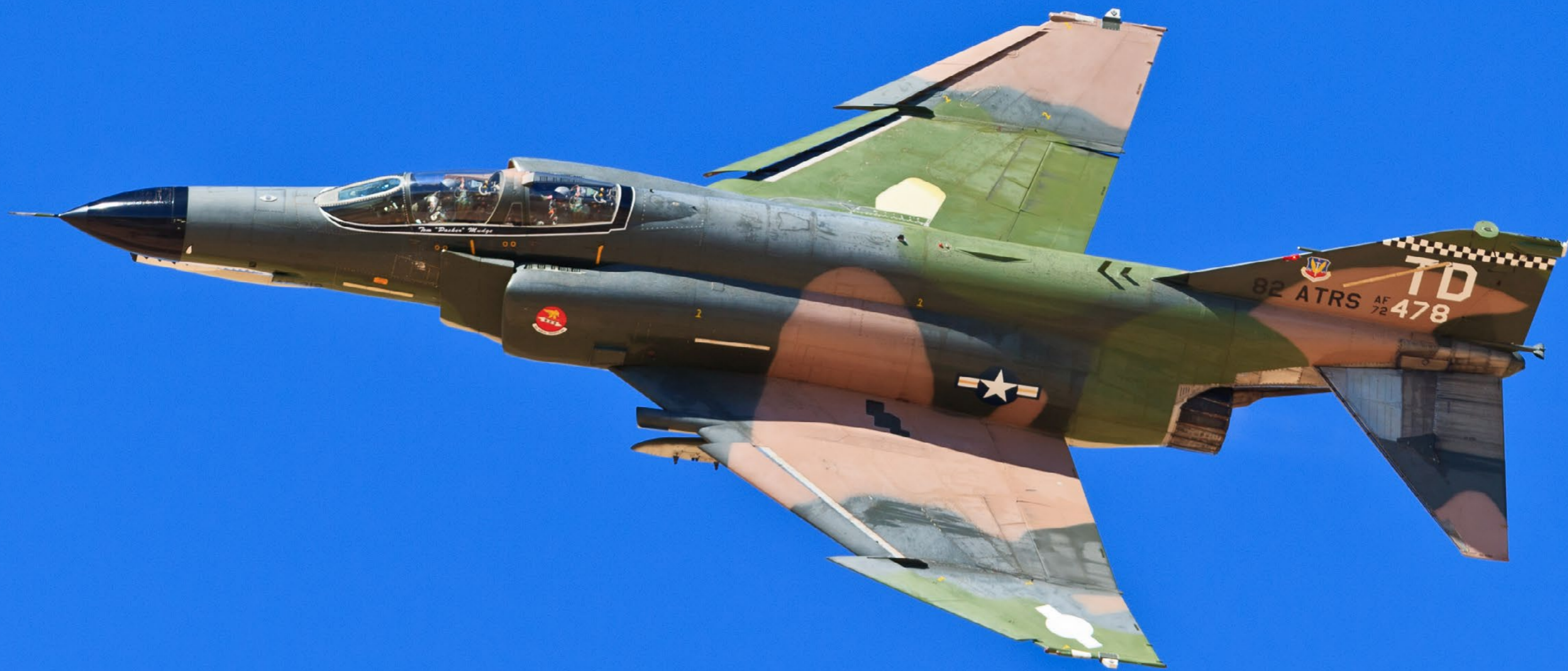
En QF-4 Phantom fra Tyndall Air Force Base gav en flot opvisning ved Holloman Air show i 2011.